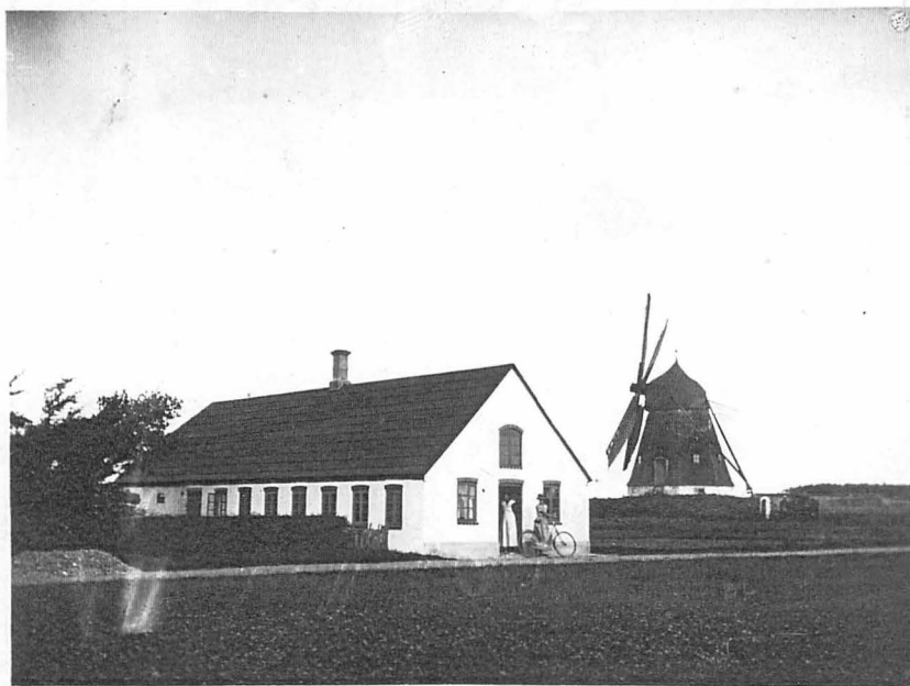
Ejerslev Mølle 1915