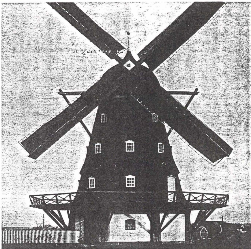
Dueholm mølle, Vesterbro ca. 1900. Vingerne var 33 alen (25¼ m) lange.

Men før møllen var genopført, solgte han såvel Dueholm som mølle