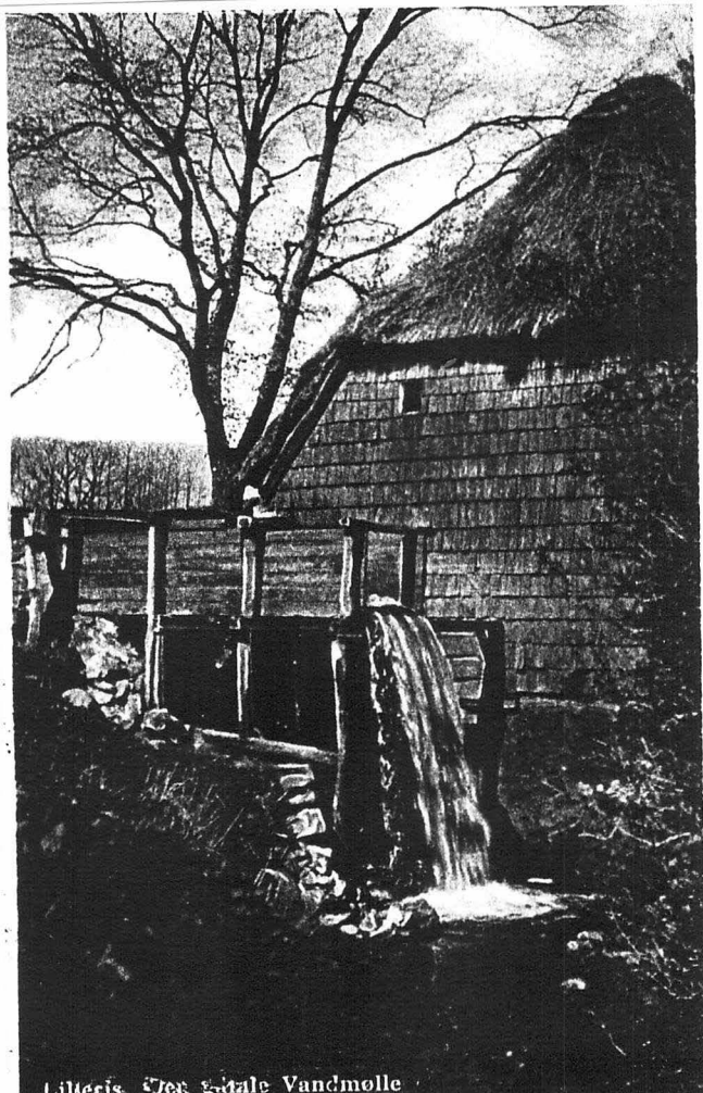
Lilleris. Den gamle Vandmølle