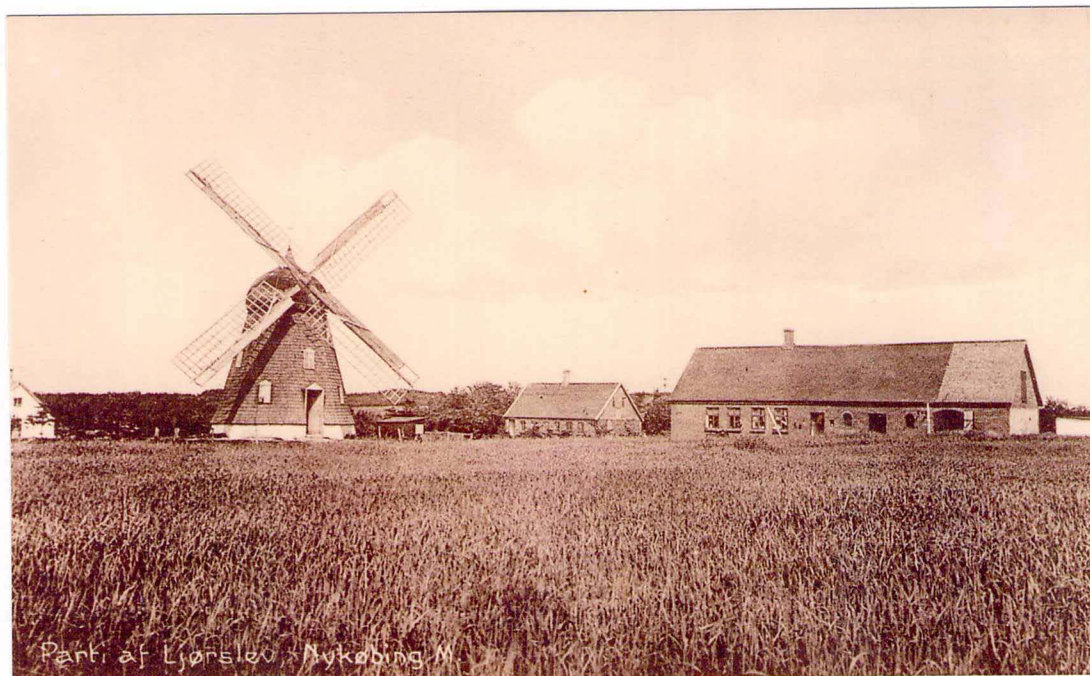
Parti af Ljorslev - Nykøbing M.