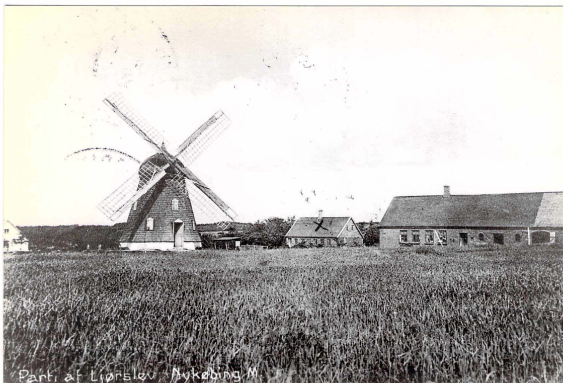
Parti af Ljorslev - Nykøbing M.