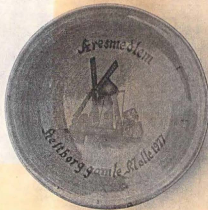
Platte med motiv af Heltborg Mølle.

lave tømmerarbejde på en gård, ville jeg knap tro mine egne øjne. Der stod 2 tønder med grutning og i den ene lå den kobbertoldkop, som vi manglede til Heltborg mølle. Gårdmanden blev tilbudt en ligeså god af eg, men det kunne han ikke tænke sig. Næste dag blev jeg tilbudt toldkoppen imod at lave en tilsvarende i træ, men på den betingelse, at den ikke måtte sælges, men kun gives til møllen. Grunden var, at vi lige var begyndt at handle med