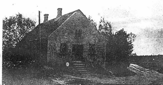
Parti fra Klim. St.