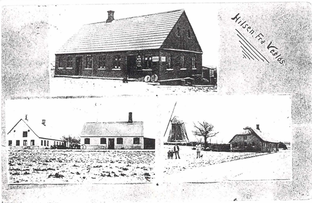
Kopi postkort; o. 1910