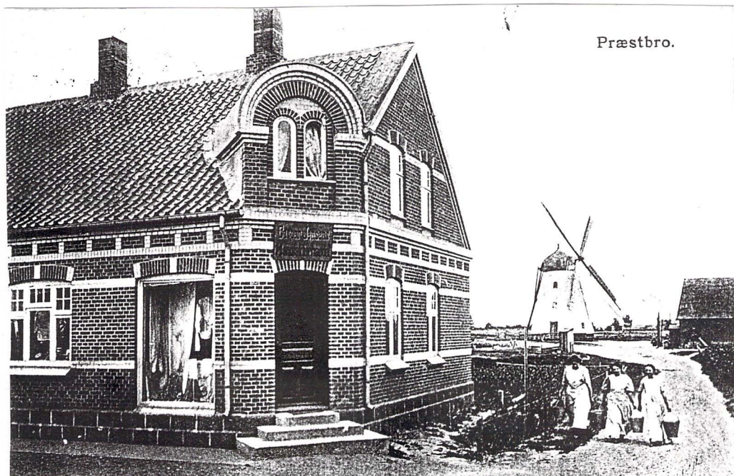
kopi postkort; o. 1911

Albæk sogn, Dronninglund herred, Hjørring amt