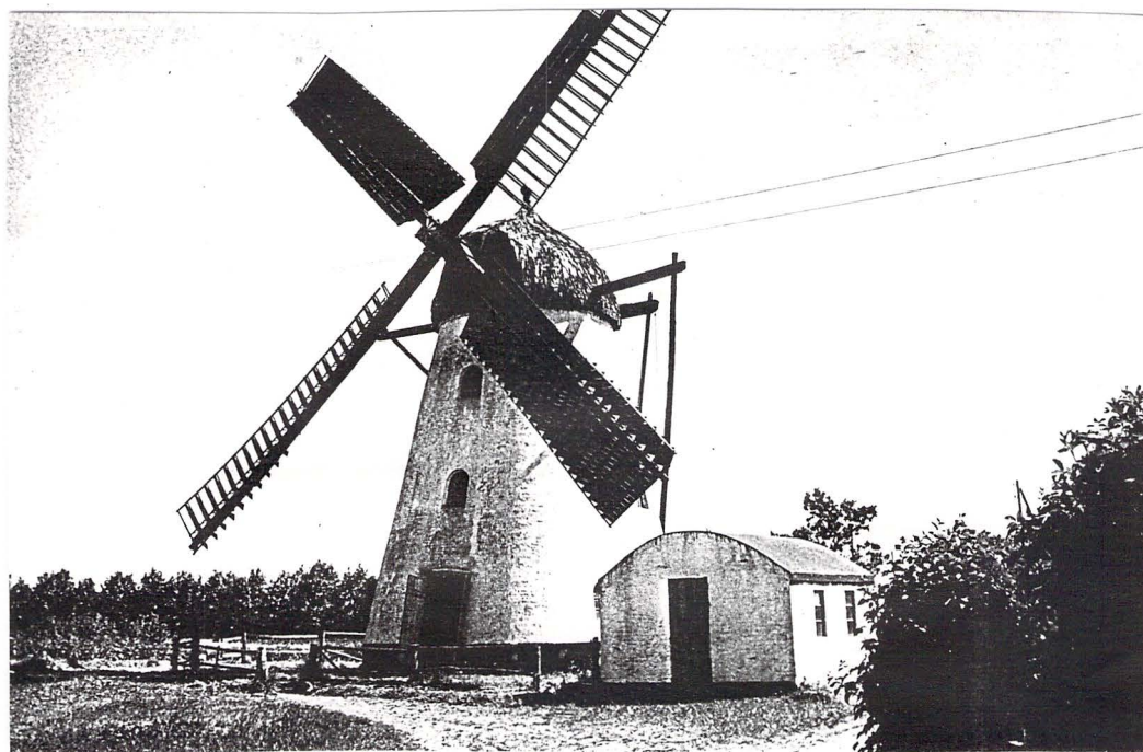
kopi postkort; o. 1950