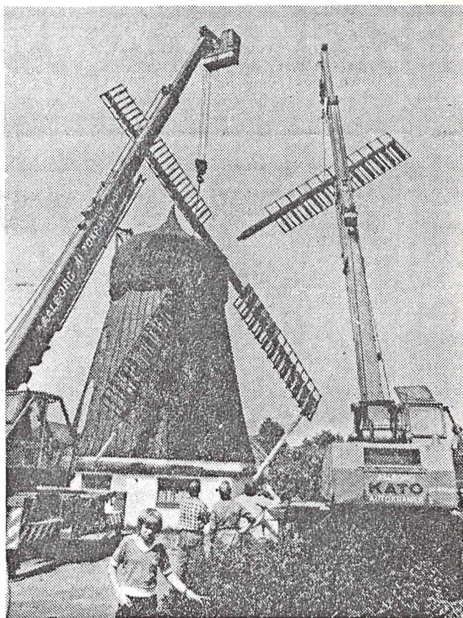
Her bliver en del af en møllevinge fjernet ved hjælp af en af de to autokraner, der var sat ind i arbejdet. Det stod på i op mod fem timer.