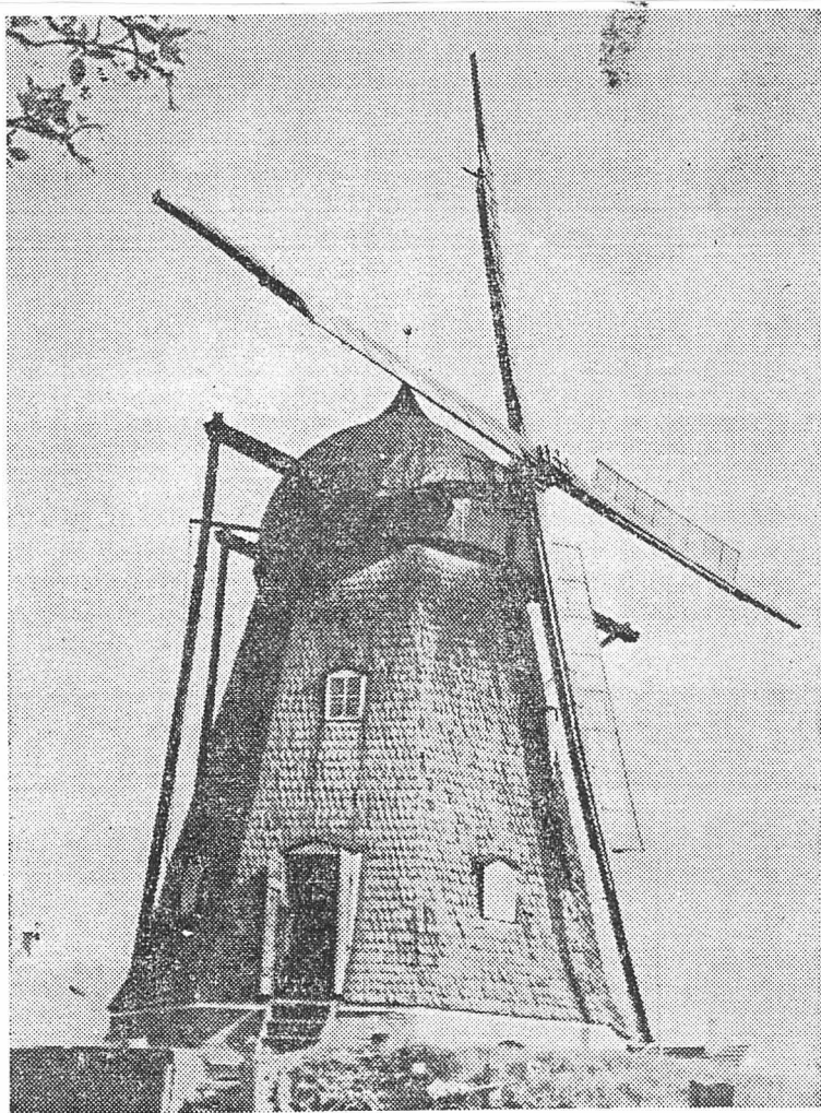
Den nu forsvundne Klokager mølle.

Anderledes nu, nu er der en park, hvor natur og kultur forenes og med en idyl — en skovsø i mindre format med aakander og nøkkeroser paa vandfladen, med guldfisk i vandet og med dunhøns ved søens brydeplads.