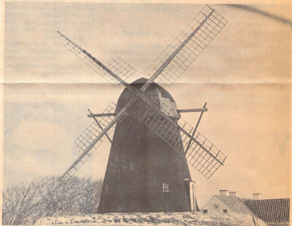
FØR: Sådan så møllen i Vennebjerg ud til omkring 1981, da den ene af de fire møllevinger faldt helt ned.