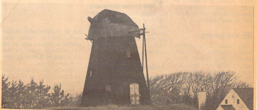
NU: Og sådan ser den ud i dag, vingeløs, men endnu med hatten på - og indvendig intakt.