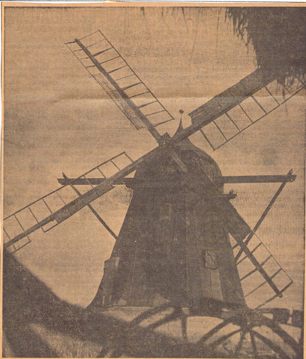
Dorf mølle har ogsaa faaet lov at staa i sin oprindelige skikkelse, men den har hjælpemotor indenbords.

En stor mølle pyntede paa en lille by. Den var dens vartegn ligesom kirketaarnet. Folk holdt af møllerne. Man var ked af det, naar lynet flækkede byens mølle. Men hvem ville betale reparation og vedligeholdelse? Mølleren kunne ikke. Siden elektriciteten kom, har det været sløjt at drive vindmølle, undtagen i et par aar under krigen. Det koster 4—5000 at udskifte et vingesæt, for det er af pommersk fyr og pitchpine. Hvis man nu mere kan finde en møllebygger, der tør paatage sig opgaven.