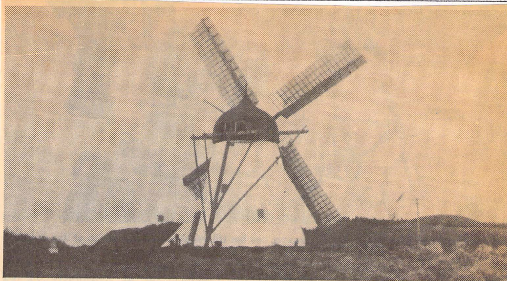
FØRST: Den første Vennebjerg Mølle, som oprindeligt kaldtes Dal eller Dale Mølle, opførtes 1859-61. I 1934 blev den revet ned og erstattet med en træmølle, beklædt med sort tagpap. Den kom fra Tversted.