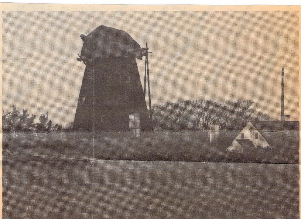
Vennebjerg Mølle - endnu vingeløs, men nu er fondet stiftet, der skal gi' den vinger. Den kom til Vennebjerg fra Tversted i 1934.

Fonden skal nu godkendes i Fondsstyrelsen i København, men det skulle der ikke være nogen problemer i.